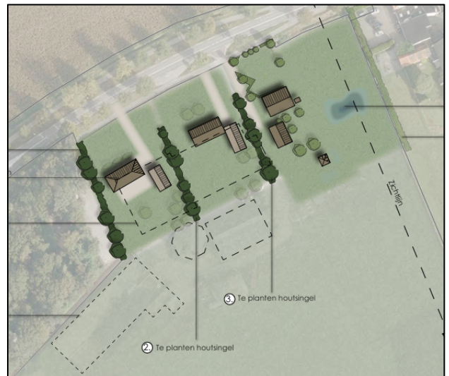
Ontwerptekening beoogde situatie