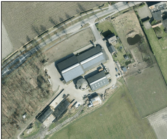
Luchtfoto bestaande situatie

Aan de Heijerstraat 37 te Westerhoven is een melkveehouderij gelegen. De eigenaar neemt deel aan de Landelijke beëindigingsregeling veehouderijlocaties (Lbv-regeling). In het kader daarvan bestaat de wens om de veehouderij te saneren, de bestaande bedrijfswoning om te zetten naar een reguliere burgerwoning en twee Ruimte-voor-Ruimte-kavels voor twee vrijstaande burgerwoningen te realiseren ter plaatse van de huidige bedrijfsbebouwing. Hiertoe is voorliggende wijziging van het omgevingsplan in procedure gebracht. Het ontwerpplan heeft gedurende zes weken voor eenieder ter inzage gelegen. Er is één zienswijze ingediend. De zienswijze heeft niet geleid tot wijzigingen in het plan. Wel zijn enkele ambtshalve wijzigingen doorgevoerd. Het plan kan nu worden vastgesteld.